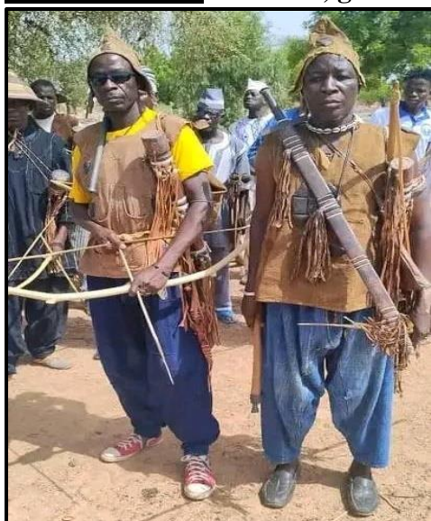
Planche Photo 1: Tānsoba , guerriers traditionnels du Moogo

La conquête nakoambga du Moogo a nécessité l'usage combiné d'une série de stratégies militaires, de moyens de persuasion psychologiques et d'armes variées.