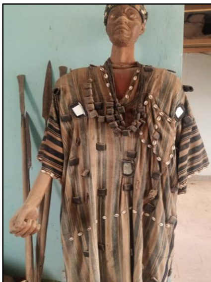
Planche photo n°2 : Moose Zab-futu (tenues de combat des Moose)

Quel était le mode d'affrontement chez les Moose ?