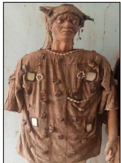
Photo A : Kōondre-fũungu , tenue de combat trempée dans une mixture rouge ocre obtenue de la sève du Kōondre ( terminalia avicennioides ). Garnie d'amulettes protectrices, elle aurait la faculté de transformer le porteur en guerrier intrépide.