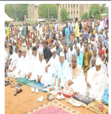
Figure n°3 : Prière musulmane à Lomé à la Tabaski, du 16 juin 2024 ; Source : https://togopresse.tg/les-musulmans-du-