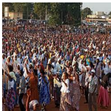
Figure n°2 : Une soirée d'évangélisation à Lomé.

Lorsque Dieu peut tout changer en une seconde ou qu'il est la solution à tout problème de l'humanité dont il contrôle le mouvement, il devient le centre de la vie individuelle et sociale. La cosmogonie chez les populations de Lomé baigne dans un univers construit sur des mythes qui attribuent à un Dieu tout-puissant la paternité de l'univers et la maîtrise de