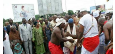
Figure n°4 : Cérémonie de purification à Lomé Le gouvernement représenté par le directeur des cultes ainsi que plusieurs autorités politiques

La plus haute altitude de cette coopération entre le Togo et les Églises est atteinte au plan politique national dans la personne de l'ancien archevêque de Lomé, Monseigneur